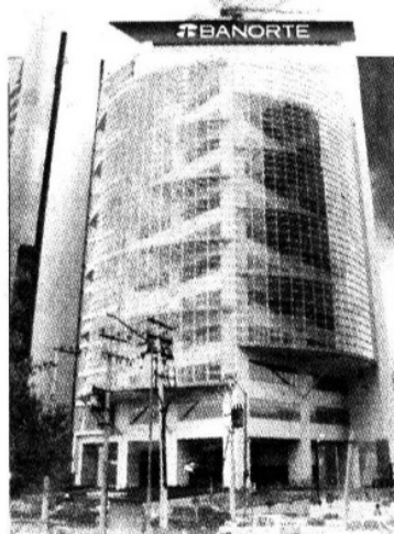
Esperan que Banorte anuncie la compra de IXE , con lo que CRECERÍA MÁS